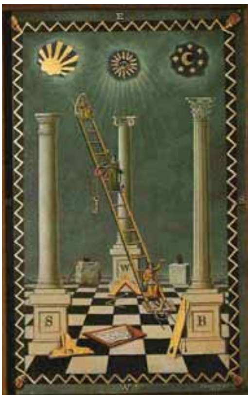
Cuadro de Primer Grado, J. Bowring, 1819